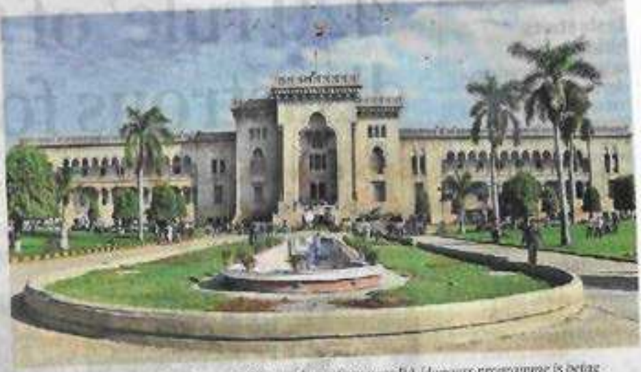
This is the first time in the university's history that a four-year BA Honours programme is being launched in the campus college

Further, artificial intelligence, which is so far limited to engineering and sci-