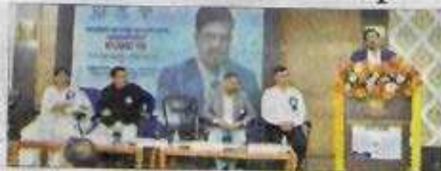
HANS NEWS SERVICE HYDERABAD

A two-day national workshop on 'Embarking on the Digital Frontier - Tools for Enhancing MOOCs Experiences' was inaugurated at Osmania University on Thursday.