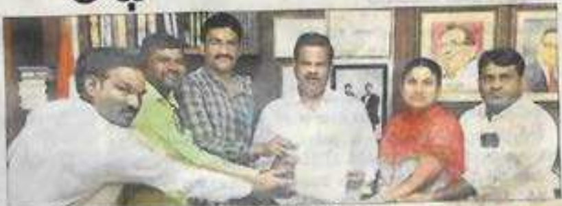
ప్రొ.బాలకృష్ణారెడ్డికి వివిధ పత్రం అందజేస్తున్న స్కూలర్స్ (ఫ్రోల్)

ఉస్మానియా యూనివర్సిటీ ఓయూ అభివృద్ధికి నిధుల లేమి అడ్డంకిగా మారినది. వర్కే ఆదాయం ఉద్యోగుల వేతనాలు, సింధిపర్తి సరిహద్దుల రేడు. వెలకు రూ.50 కోట్ల మేర వేతనాలు. సింధిపర్తి కెన్డ్రం చార్జి వసూలకు దీంతో వర్కే అభివృద్ధి చౌరక వసతుల కల్పన కుంబుబిల్లాయి అధ్యాపకుల ఉద్యోగ నియమల మయిస్తు 80 పెళ్లకు సింధి. కొత్తగా 375 మంది ఫ్రూన్-4 ఉద్యోగుల రాకతో మరో రూ.50 కోట్లు అదనంగా అవసరమవుతున్నాయి. వెలకు మొత్తం రూ.100 కోట్లు వేతనాలకు సింధిపర్తి కావాలి అంటుంది. కొత్తగా పర్మినెంట్ అధ్యాపకులను నియమిస్తే వేతన పెట్టెంపులు రెట్టించివేస్తే అవ కావమంది. కేవలం ఒక్క వర్కేలో అంత పెద్ద మొత్తంలో వేతనాలు పెట్టించేందుకు రాష్ట్ర ప్రభుత్వం మునుంథంగా లేనట్లు తెలిసింది. వేతన భారాన్ని తట్టుకోలేక గత 15 ఏళ్లకూ ఓయూలో పార్టీల్ని అధ్యాపకులతోనే నిర్వహిస్తున్నాడు. మరోసారి వర్కే