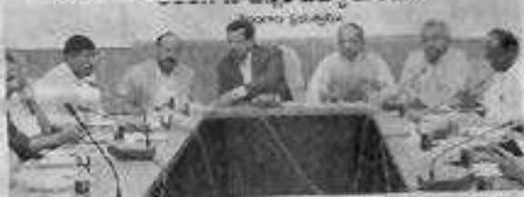
సవరించగాని డ్యూరో - సైదరాలార్

అర్థమెడిక్, రీజనింగ్ ఉండాలని ఉన్నత విద్యామండలి సమాలోచన చేస్తున్న డిగ్రీ సైన్స్ విద్యార్థులకు అర్థమెడిక్, రీజనింగ్ ఉంటే భాగంబుందన్న ఆలోచనానికే వచ్చింది. అందులో భాగంగానే డిగ్రీ (డిగ్రీ) కోర్సుల్లో మ్యాథ్స్ సెక్షన్లను చేర్చాలని అభిప్రాయపడింది. ఈ విధంగా డిగ్రీ సిలబస్ను మార్చాలని ఉన్నత విద్యామండలి అధికారులు భవనాన్ని చేస్తున్నారు. డిగ్రీ పూర్వయాగా పోటీ పరీక్షల కోసం విద్యార్థులు పన్నవేళ్ళు వేయడం తెలిసింది. గ్రామ్, ఇతర పోటీ పరీక్షల్లో మ్యాథ్స్కు సంబంధించిన అర్థమెడిక్, రీజనింగ్ అంశాలపై ప్రశ్నించబడాలి వాటిని అర్థం చేసుకుని మార్కులు సంపాదించడం కోసం సైన్స్ అభ్యర్థులు కోరికలు వారి ముందుగాను రూపొందించే అర్హులు చేస్తున్నారు. ఈ విషయం ఉన్నత విద్యామండలి, విశ్వవిద్యాలయాల వ్యవస్థీకృత వచ్చింది. అందు కోసమే డిగ్రీ సైన్స్లోనే సైన్స్ విద్యార్థులకు మ్యాథ్స్, సైన్స్ అంశాలను కట్టిపెట్టే భాగంబుందన్న ఆలోచనానికే వచ్చాయి. ఈ విధంగా సిలబస్లో మార్పులు చేసే అవకాశమున్నది.