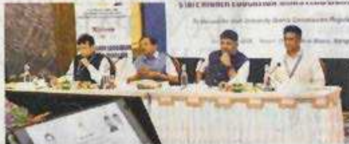
IT Minister D Sridhar Babu takes part in national-level Higher Education Ministers' Conclave in Bengaluru with Karnataka DCM DK Shivakumar and other ministers

He said the UGC Draft Regulations 2025 must strike a balance between national policies and the interests of individual states. "Karnataka has always