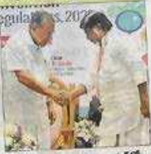
కేరళ మంజ్యమంత్రి విజయన్ తో డిప్యూటీ సీఎం చట్ట కరచాలనం

పాల్గొని హైదరాబాద్ భారత రాజ్యాంగంలో విద్య ఉమ్మడి వాటిలో ఉంది, దానిపై కేంద్ర ప్రభుత్వ గుత్తాధిపత్యం వదిలిరావని డిప్యూటీ సీఎం చట్ట విక్రమార్క అన్నారు. విద్యపై కేంద్రానికి గుత్తాధిపత్యం కట్టబెట్టేందుకు యూజీసీలో లాంఛ్ కమిషన్ (యూజీసీ) కొత్త మార్గదర్శకాలను తీసుకొచ్చాడని ఆరోపించారు. రాష్ట్రాలు కనుసాంక విద్యానిధానాన్ని రూపొందించుకోవడానికి ఆధికారం ఉండాలని ఆతిప్రాయవద్దారు. విద్యా వ్యవస్థను డిజైన్ సుంచి రిమోట్ కంట్రోల్ ద్వారా నడవలేదు కేర్ల విస్తారు. కేరళ ప్రభుత్వం తిరువనంతపురంలో గురువారం నిర్వహించిన వాతీయ ఉన్నత విద్యా సమీక్షనంలో చట్ట మాట్లాడారు. 'యూజీసీ నిబంధనలు మీరు విజ్ఞపెట్టించాలి కానీ ఫుల్ ఆర్డర్ తీయలేరు అన్నట్లుగా ఉన్నాయి. వచ్చిపోతున్న ప్రభుత్వాలు నిరులు నమూనాల్లో కేంద్రమైన ఫైన-లాస్ట్ లక్ష నియామకం. ప్రవేశాలపై ఆధికారం మాత్రం కేంద్రానికి ఇవ్వాలని ముసాయిదాలో ఉంది. పైకి లాస్ట్ లక్ష నియామకానికి కేర్ల కమిటీలో రాష్ట్ర ప్రభుత్వ పాత్రను తొలగించడం, పైకి లాస్ట్ లక్ష అవ్వతలు మార్చడం ఆంధ్రానకరం. ఇది ఇలాగే కానసాగితే రాష్ట్రాలు భవనాలు ప్రారంభించే రిప్పన్ కేటింగ్ ఆధికారానికి మాత్రమే పరిమితమవుతాయి అని పేర్కొన్నారు.