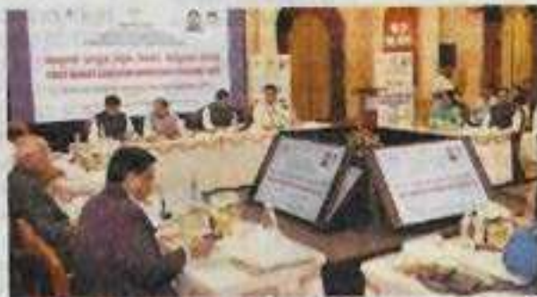
Power play: The States say that the BJP-led Centre is trying to push its ideology through the new regulations.

This was the outcome of the conclave of State Higher Education Ministers, 2025, hosted by Karnataka. Representatives from Himachal Pradesh, Jharkhand, Kerala, Tamil Nadu, Telangana and Karnataka