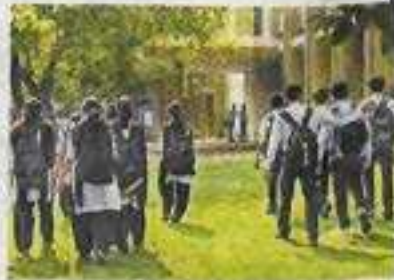
తర్వాత మాత్రమే కోటా ఎత్తివేత తీవ్ర జప్తుల్ని ఉంది. ఈ విషయాన్ని ప్రభుత్వం దృష్టికి తీసుకుం... ఏది విభాగాలు ఏ విధంగా ఉంటాయోనీ ప్రభుత్వం నుంచి అధికారులు వివరాల తెలుసుకుంది. ఇందుకు తగ్గట్టుగానే నిర్ణయాలు తీసుకుంటారు. . . ప్రభుత్వం ఆ అనుమతిచ్చకపోవడంతో కాలేజీలు

కల్ కోటా అమలుకు రాష్ట్రపతి ఉత్తర్వులు జార్యం. గత ఏడాది ఎన్.సి.టి నోటిఫికేషన్ సమయానికి పరీక్షలు పూర్తి కాలేదు కాబట్టి నాన్-లోకల్ కోటా అమలు కాలేదు. అయితే, నాన్-లోకల్ కోటా ఎత్తి వేసే ముందు రాష్ట్రపతి అనుమతి అవసరమని అధికారులు చెబుతున్నారు. రాష్ట్ర ప్రభుత్వం జప్తు చేసే ఈ విద్యార్థులకు రాష్ట్రపతి తవనన అధికారికంగా తెలియజేయడం, రాష్ట్రపతి అనుమతి వచ్చిన