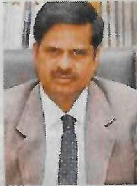
బ్యూరోక్రాట్స్ ను వీసీలుగా నియమించాలనుకోవడం సరికాదని పేర్కొన్నారు. యూజీసీ